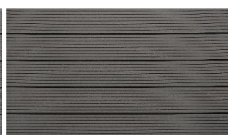
Hellgrau massiv genutet