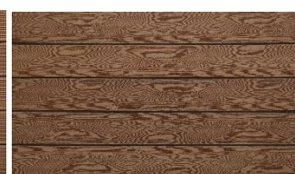
Hellbraun massiv struktur