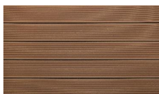
Hellbraun massiv gerillt