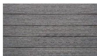
Hellgrau massiv gebürstet