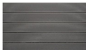
Hellgrau massiv gerillt