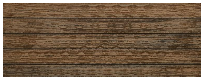
Thermoeiche (Optik) gebürstet