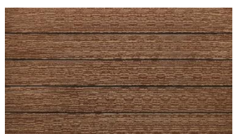
Hellbraun massiv gebürstet