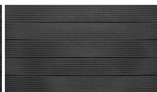
Dunkelgrau massiv genutet