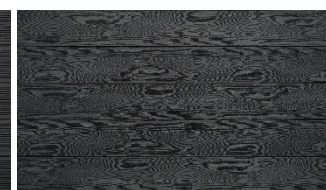
Dunkelgrau massiv struktur

Das Naturprodukt Holz ist einzigartig in seiner Form und Beschaffenheit. Struktur- und Farbunterschiede unterstreichen seine Individualität und stellen keinen Mangel dar. Mit unserer langjährigen Erfahrung und der Liebe zum Holz sind wir stets bestrebt Ihnen ein einwandfreies Produkt zu liefern. Gänzlich können wir vereinzelte Sortier- und Produktionsfehler nicht ausschließen, welche jedoch 5% der Liefermenge nicht überschreiten.