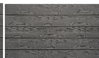
Hellgrau massiv struktur