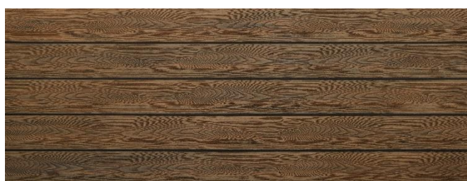
Thermoeiche (Optik) struktur