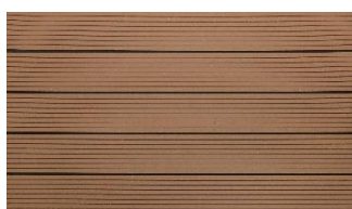
Hellbraun massiv genutet