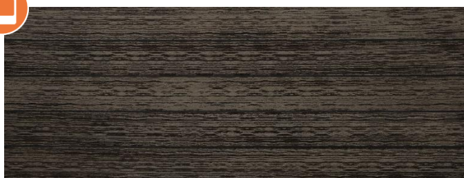
Thermoesche (Optik) gebürstet