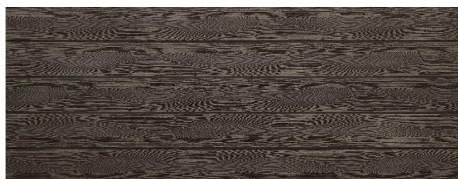
Thermoesche (Optik) struktur