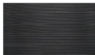
Dunkelgrau massiv gerillt