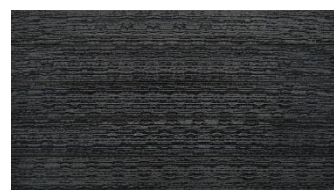
Dunkelgrau massiv gebürstet